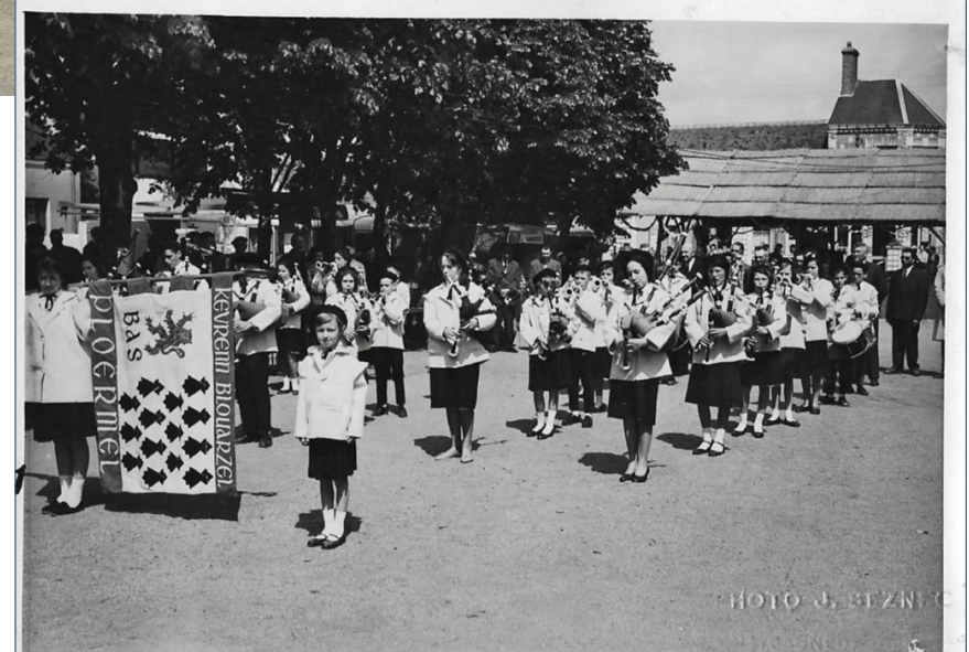
Souvenirs du Bagad dorénavant composé d'enfants.