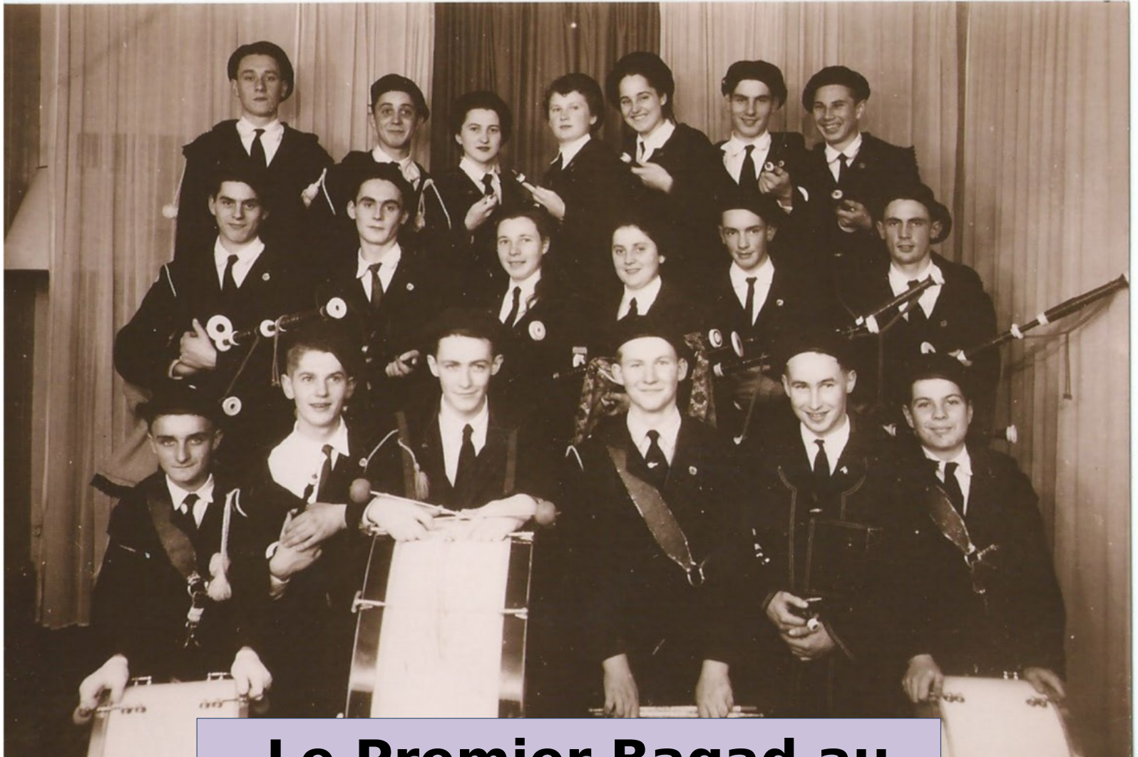
Le Premier Bagad au complet