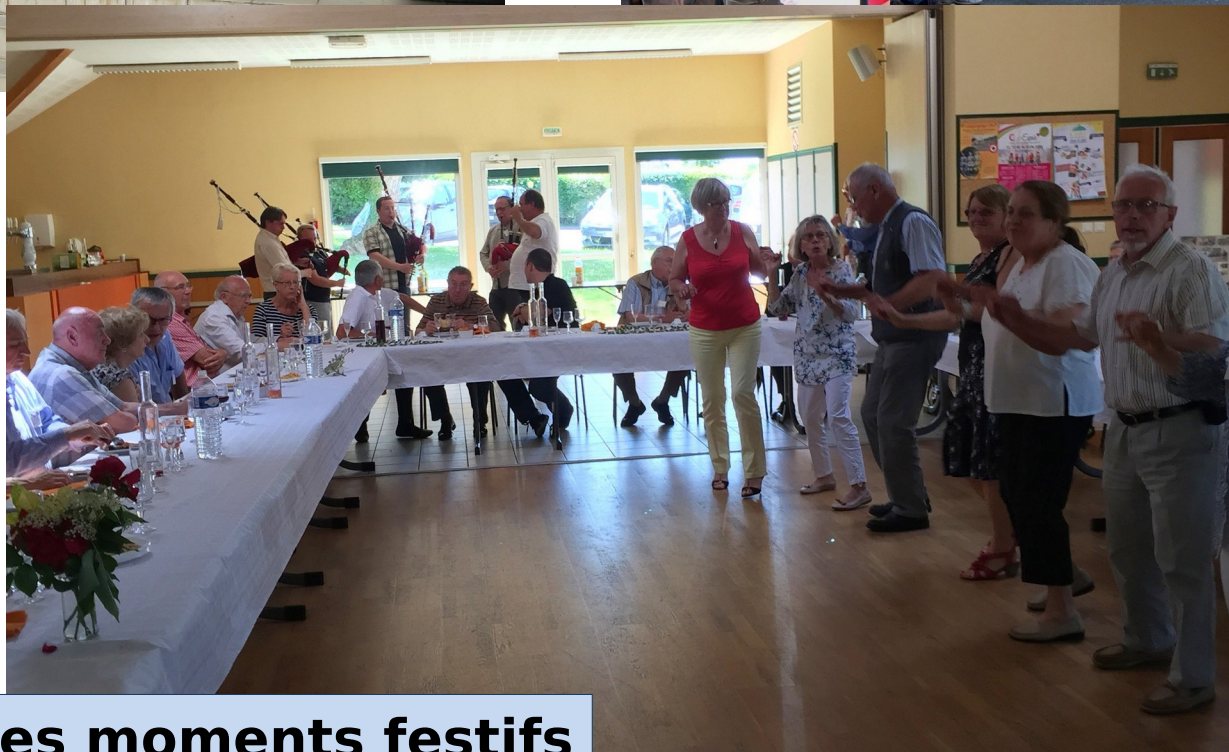
Quelques moments festifs