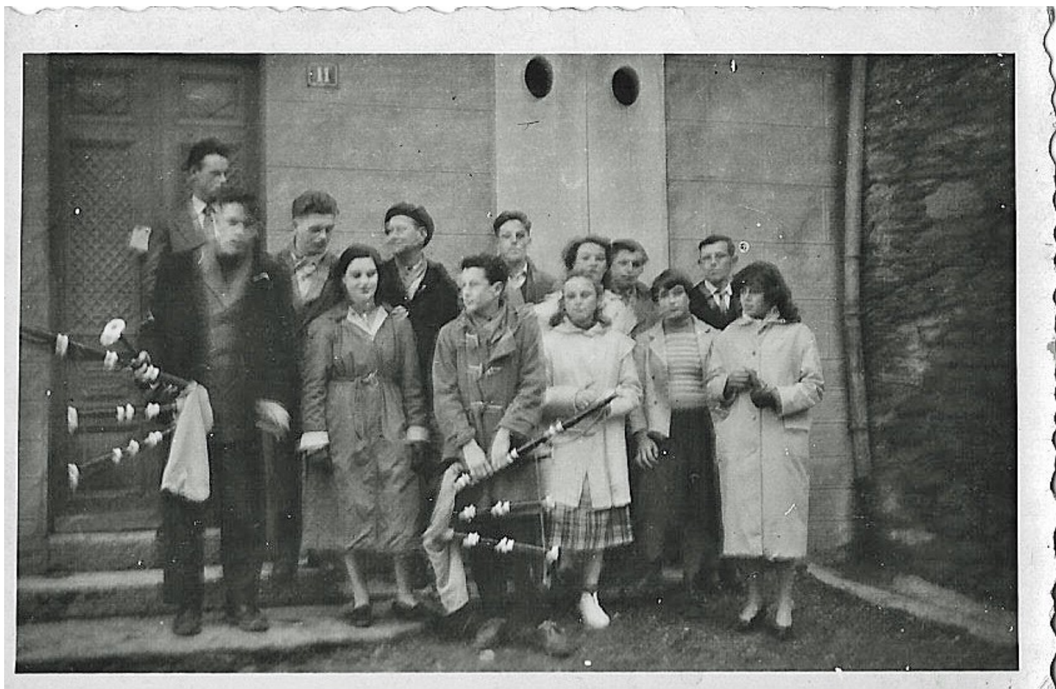
Un groupe de danseurs pose devant une maison de la place d'armes où se situe son local d'entraînement