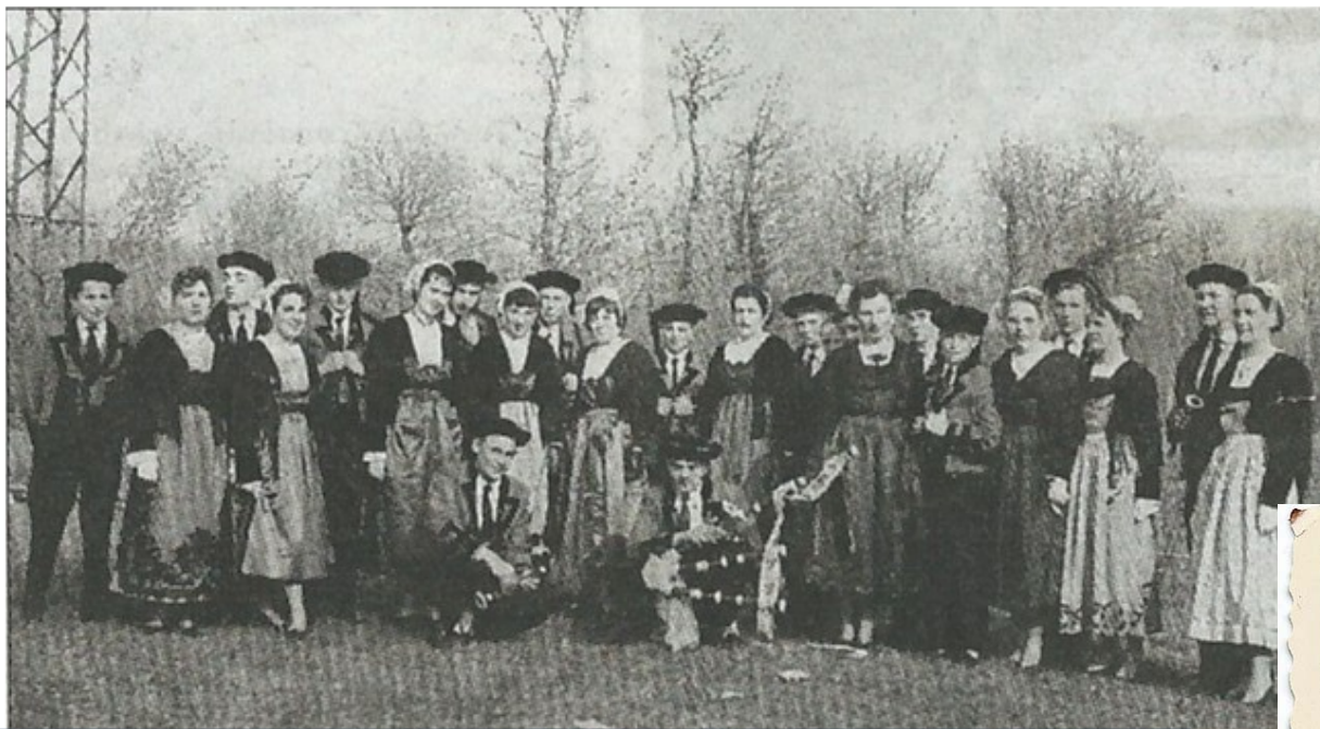
Le Cercle Celtique en 1955