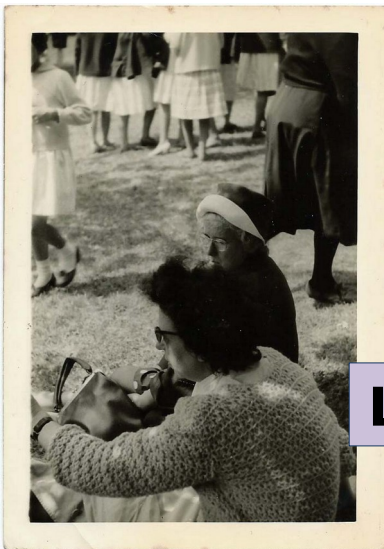
L'intendance suit, en civil ou en costume