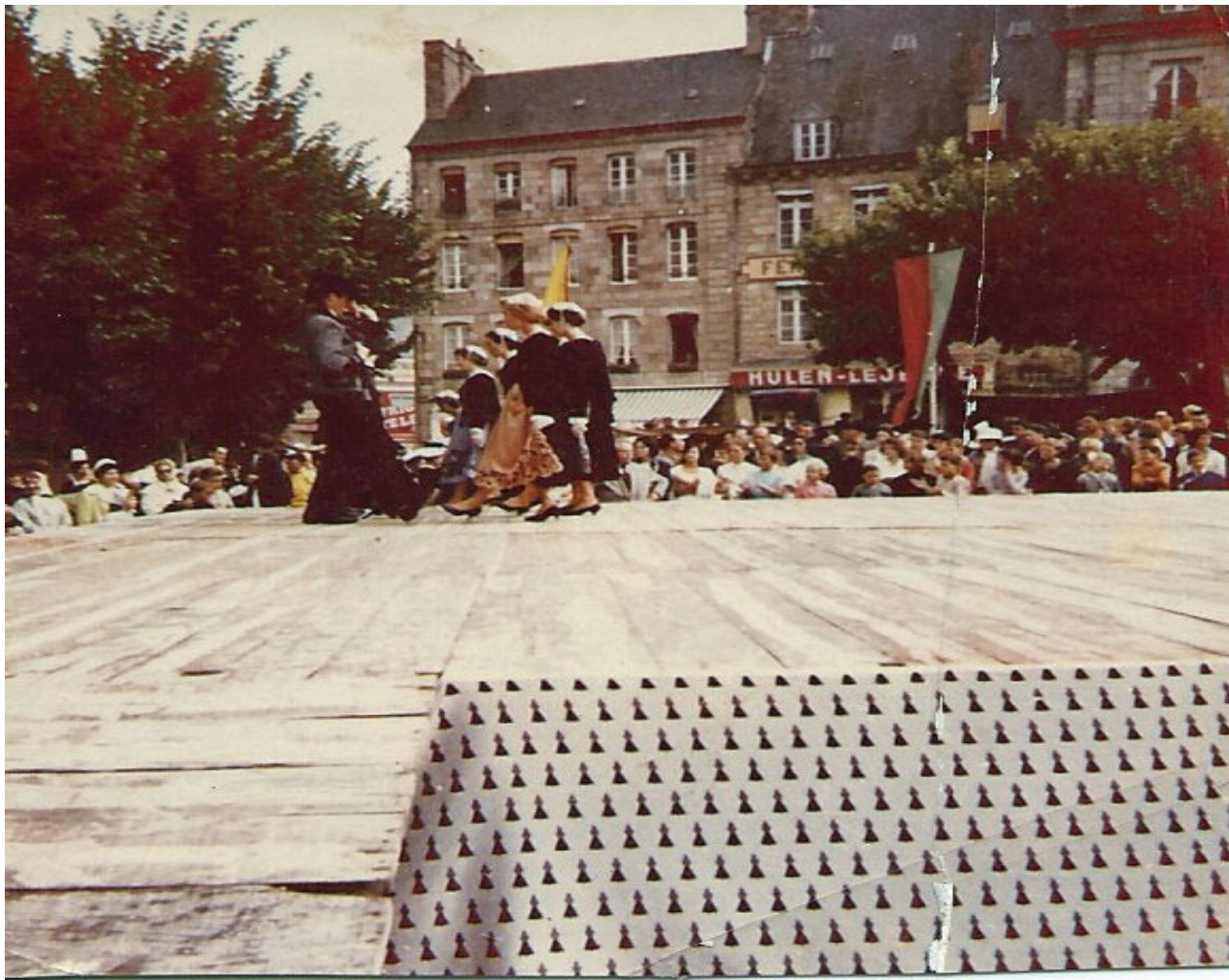
Participation aux concours: ici concours de danse lors de la fête Saint-Loup à Guingamp (obtient le premier prix en danse imposé)